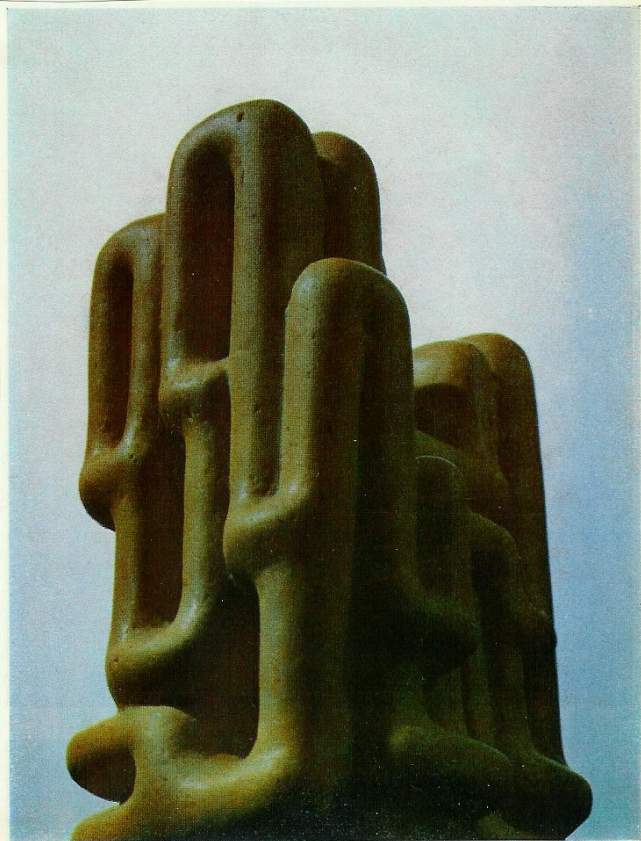
3. Bioštruktúra. Fontána. Epoxid, 1975—1976